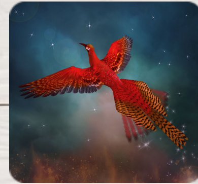
L'Oiseau de feu, Igor Stravinski