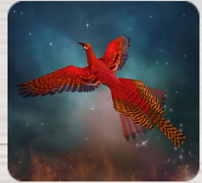
L'Oiseau de feu, Igor Stravinski