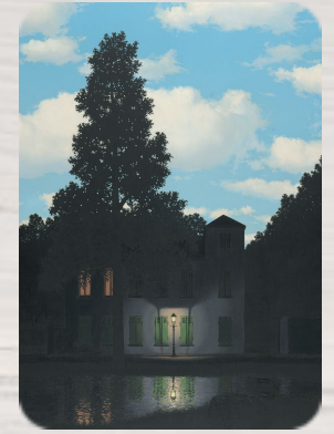
L'Empire des lumières, René Magritte