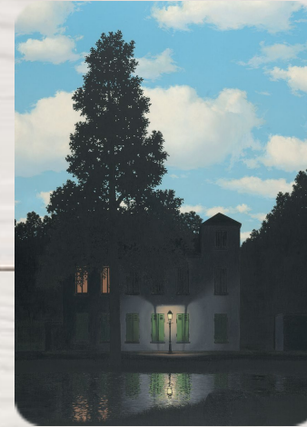
L'Empire des lumières, René Magritte