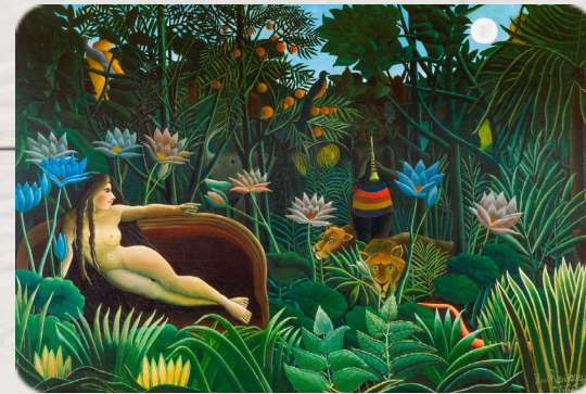
Le Rêve, Henri Rousseau