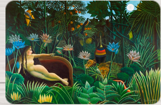
Le Rêve, Henri Rousseau