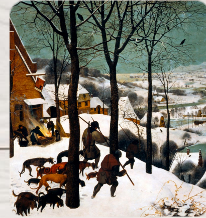
Chasseurs dans la neige, Pieter Bruegel l'Ancien