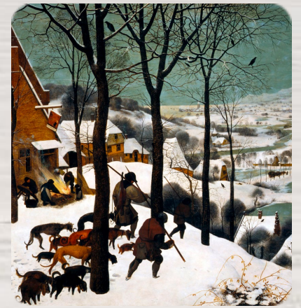
Chasseurs dans la neige, Pieter Bruegel l'Ancien