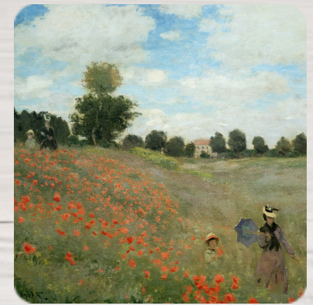
Les coquelicots, Claude Monet