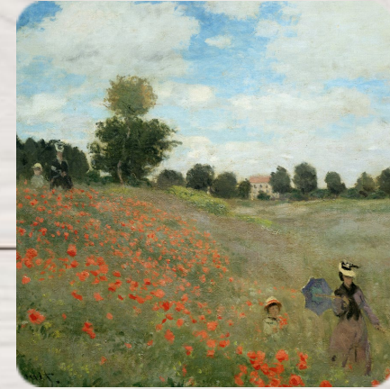
Les coquelicots, Claude Monet