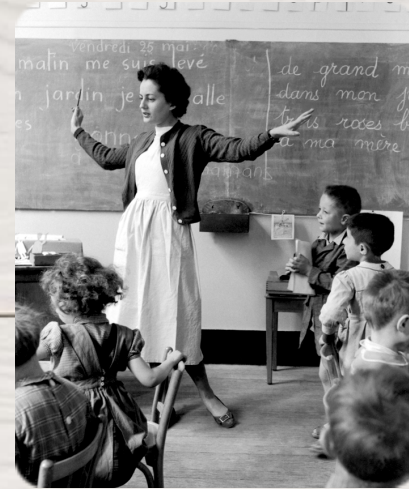
La maîtresse et ses élèves, Robert Doisneau