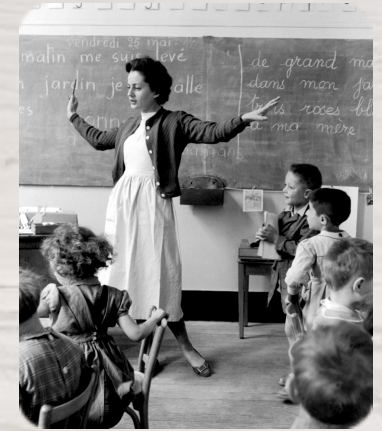
La maîtresse et ses élèves, Robert Doisneau