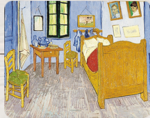
La Chambre à coucher, Vincent Van Gogh