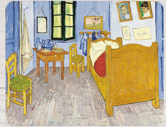
La Chambre à coucher, Vincent Van Gogh