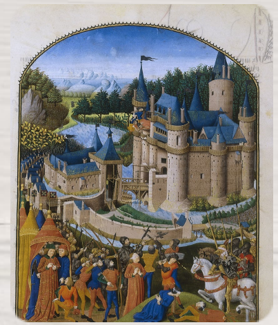
Le Siège du château de Derval, Pierre Le Baud