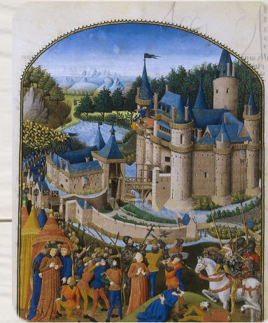
Le Siège du château de Derval, Pierre Le Baud