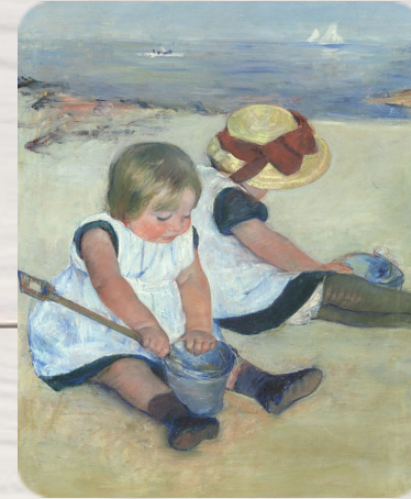
Enfants jouant sur la plage, Mary Cassatt