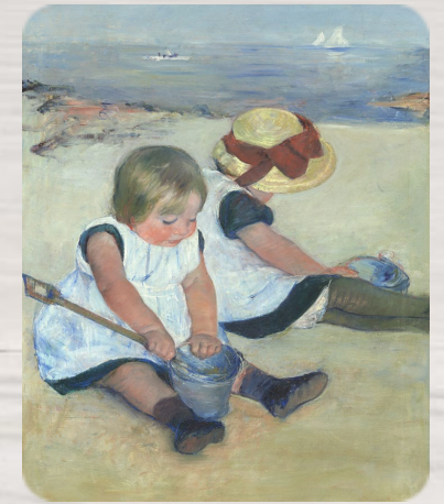
Enfants jouant sur la plage, Mary Cassatt