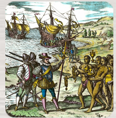
Christophe Colomb débarque à Hispaniola, Théodore de Bry