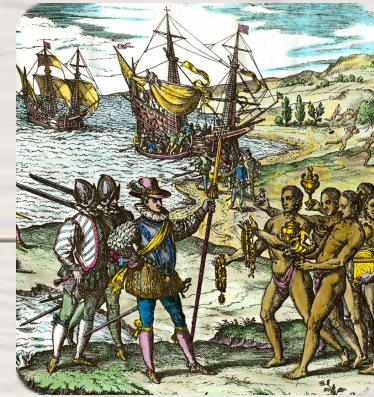
Christophe Colomb débarque à Hispaniola, Théodore de Bry