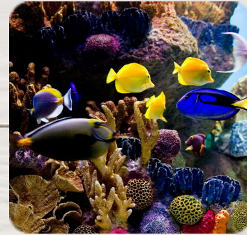
Le Carnaval des animaux, Camille Saint-Saëns