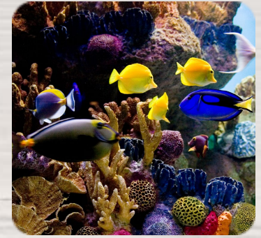
Le Carnaval des animaux, Camille Saint-Saëns