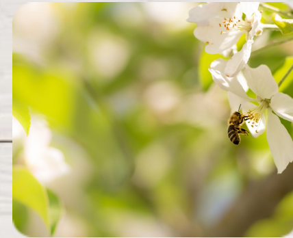
Les Quatre Saisons, Antonio Vivaldi

Écrire «eil, evil, ail, ouil» ou «eille, euille, aille, ouille»