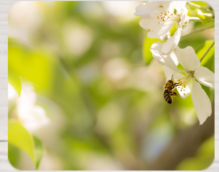
Les Quatre Saisons, Antonio Vivaldi