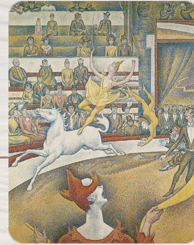
Le Cirque, Georges Seurat