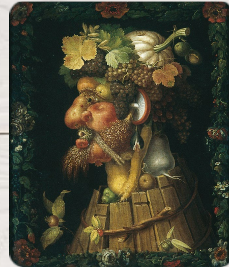
L'Automne, Giuseppe Arcimboldo