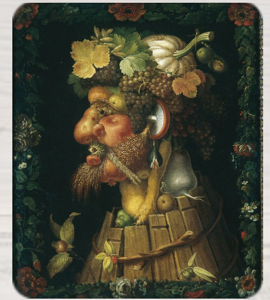
L'Automne, Giuseppe Arcimboldo