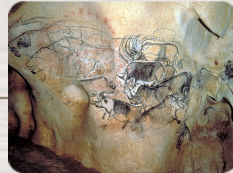
La grotte Chauvet, Artistes inconnus