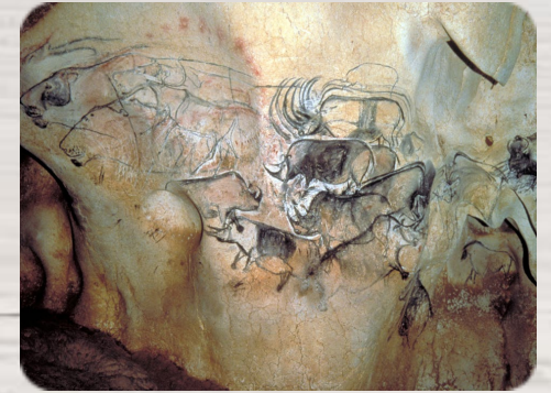
La grotte Chauvet, Artistes inconnus