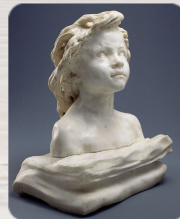
La Petite Châtelaine, Camille Claudel