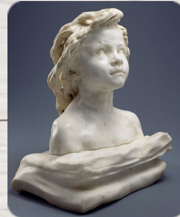
La Petite Châtelaine, Camille Claudel