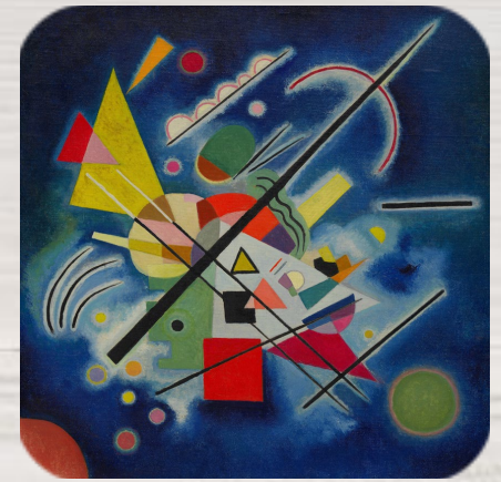
Peinture bleue, Vassily Kandinsky