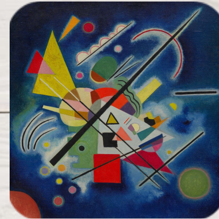
Peinture bleue, Vassily Kandinsky