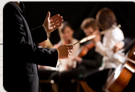
Le Boléro, Maurice Ravel