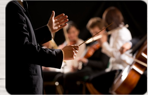
Le Boléro, Maurice Ravel